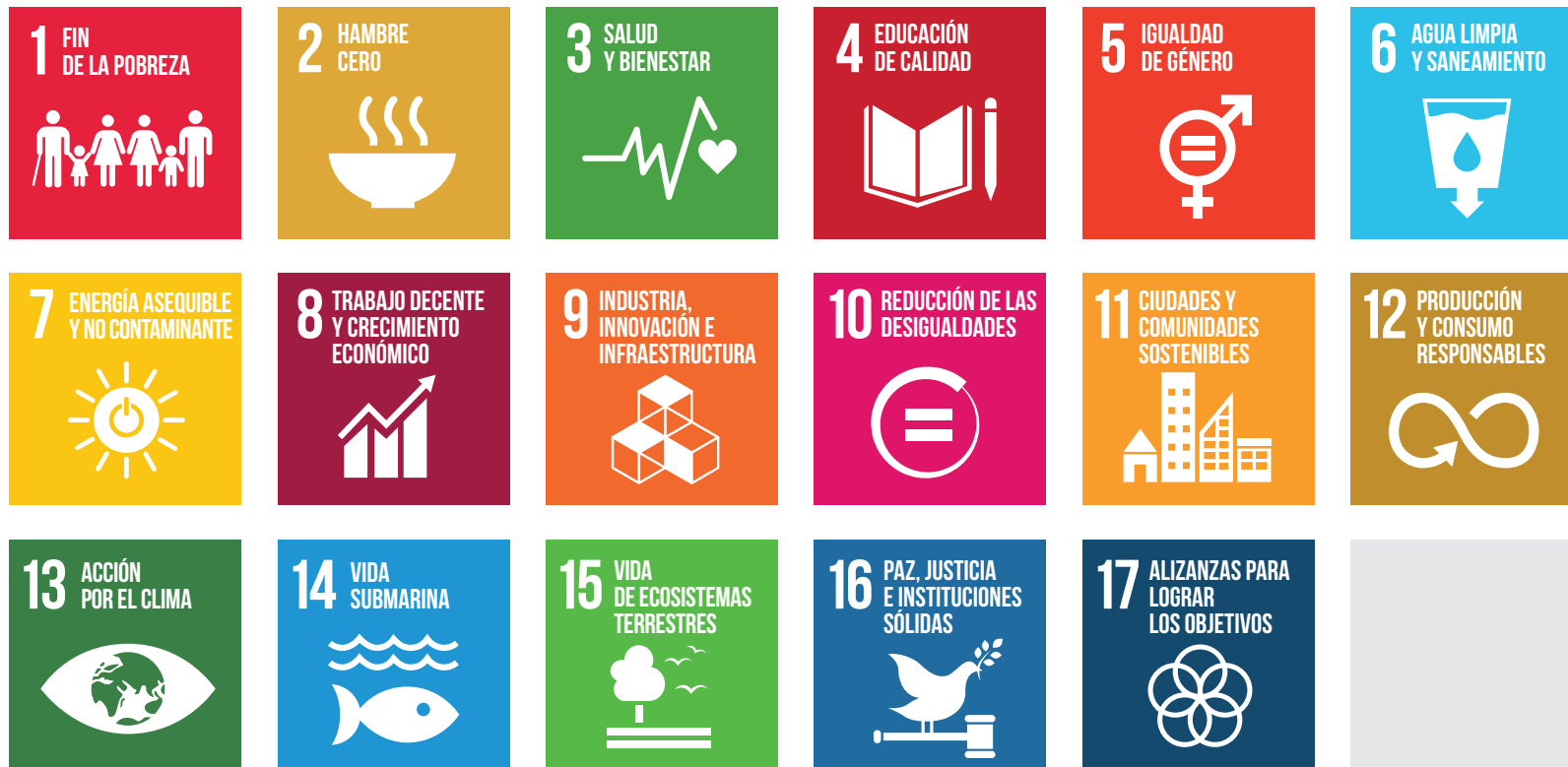
Figura 15 Los 17 Objetivos de Desarrollo Sostenible